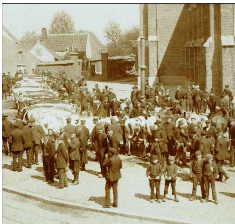
▲ De Plaats zag er behoorlijk beestig uit op de Knesselaarse veemarkt.

De veemarkten waren toch wel hele gebeurtenissen, zo blijkt uit enkele krantenverslagen: ‘Maandag laatst heeft